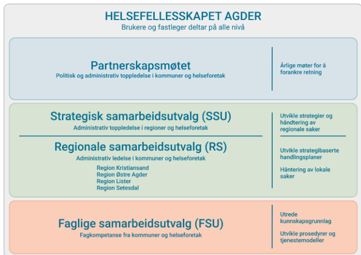
Figur 1: Helsefellesskapet Agder